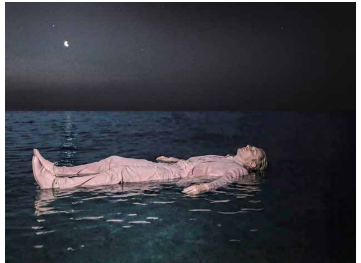
L'ILLUSIONNISTE, 2026 Dptyque présenté en miroir inversé Photographie numérique Impression pigmentaire sur papier Fine Art 30 X 40 cm x 2 Tirage 1/5

Thomas Zunderlust s'aventure au cœur des nouvelles possibilités qui brouillent les pistes entre image et photographie, virtualité et matérialité, l'imaginaire et le réel. Issu de l'univers de la mode et du style, il développe de façon autodidacte son rapport à l'image, sa propre technique, et privilégie désormais la rareté à la profusion.