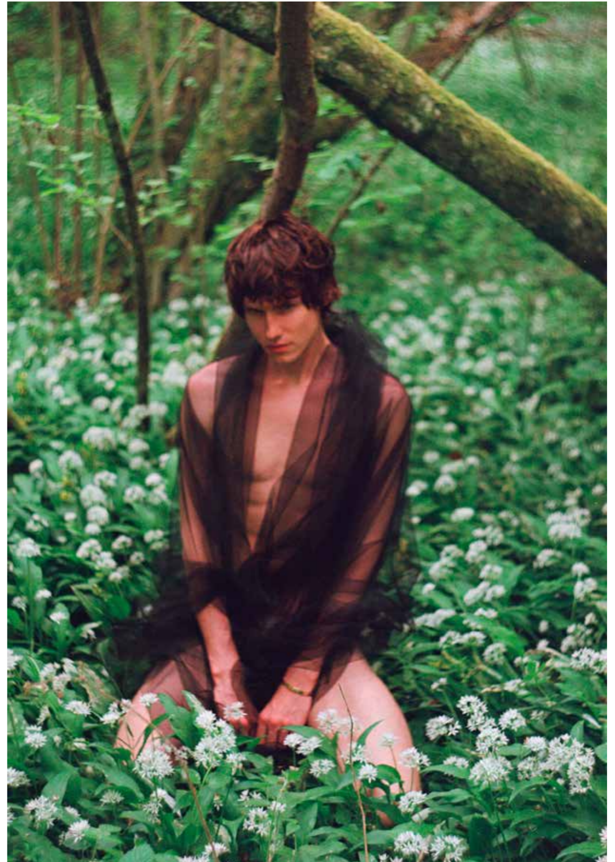
VOUS ÊTES PRÊT ?, 2026 Photographie argentique Impression sur aluminium 50 x 75 cm Tirage 1/1