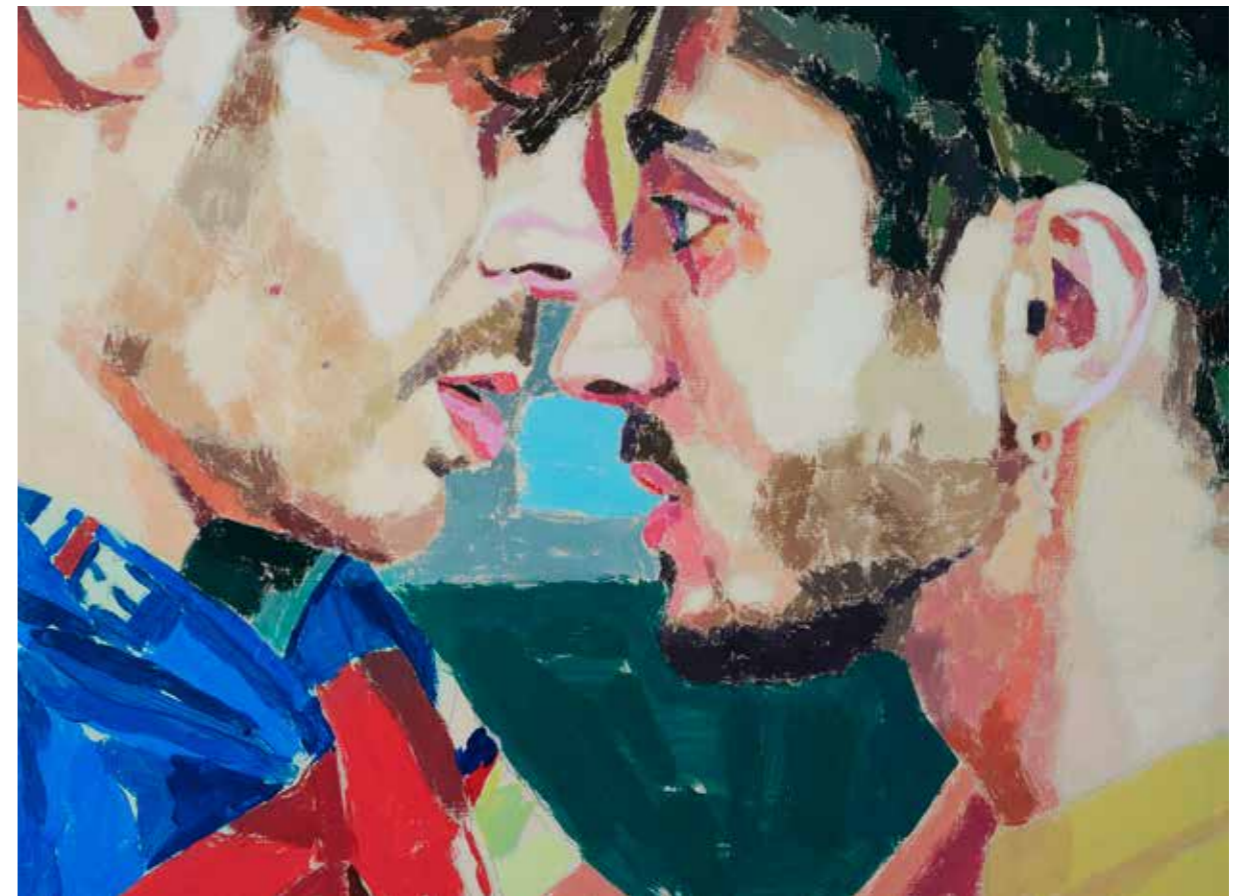
RÊVE DÉSIR, 2026 Acrylique sur medium 38 x 28 cm

Par la lumière et la matière, il révèle les corps et les liens qui les unissent, accordant une place sensible aux figures masculines, représentées avec douceur et invitant le spectateur à une identification intime.