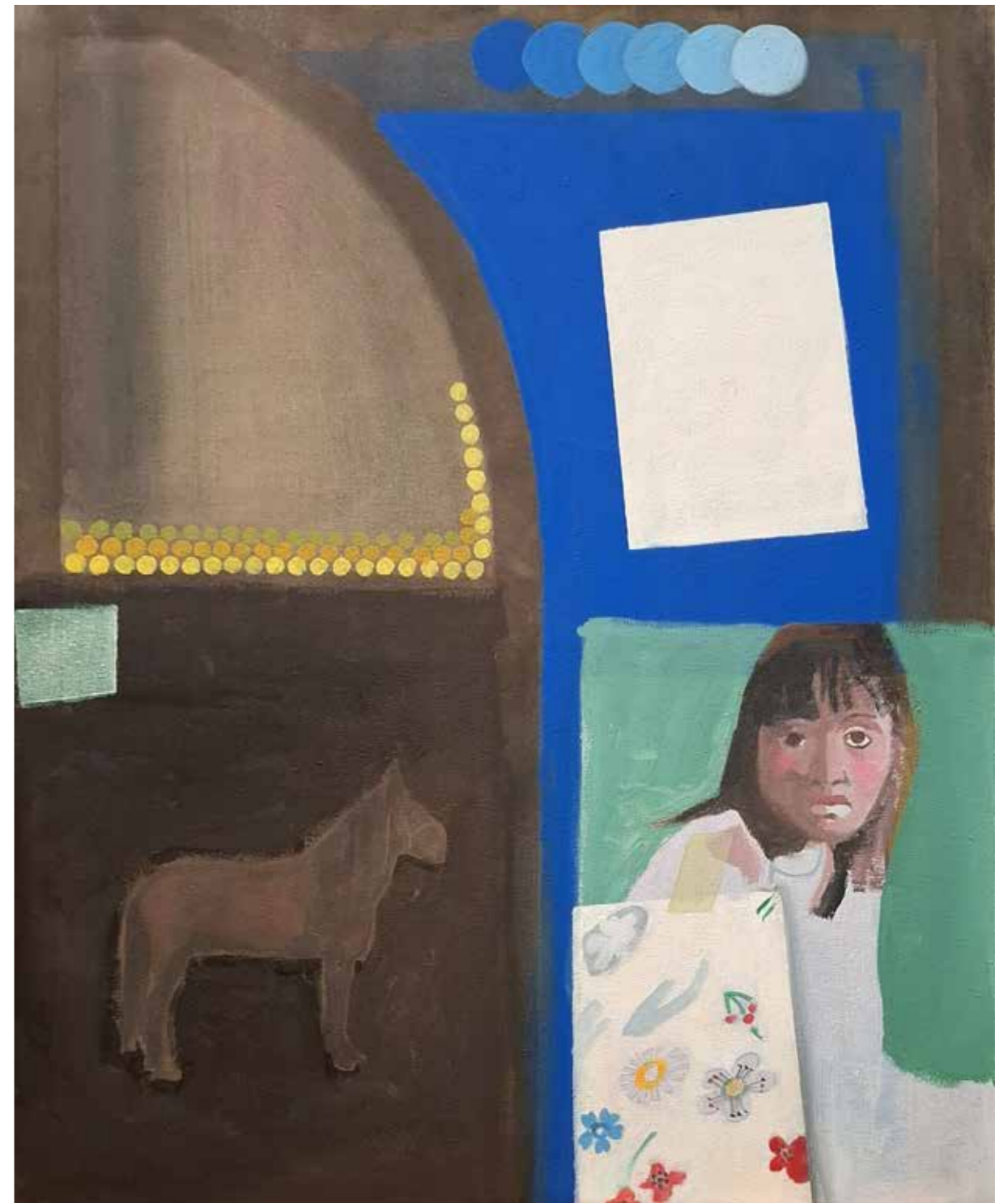
PORTRAIT SAUVAGE, 2026 Acrylique sur toile 61 x 50 cm

Artiste franco-suisse, Anne Emery expose entre Paris, la Suisse et l'Italie. Son travail est un kaléidoscope de réflexions et d'explorations entre le figuratif et l'abstrait, elle façonne un univers où les éléments visuels sont des entrées vers des réalités multiples. En 2024, à Paris, Yoyo Maeght a présenté une importante exposition de ses peintures.