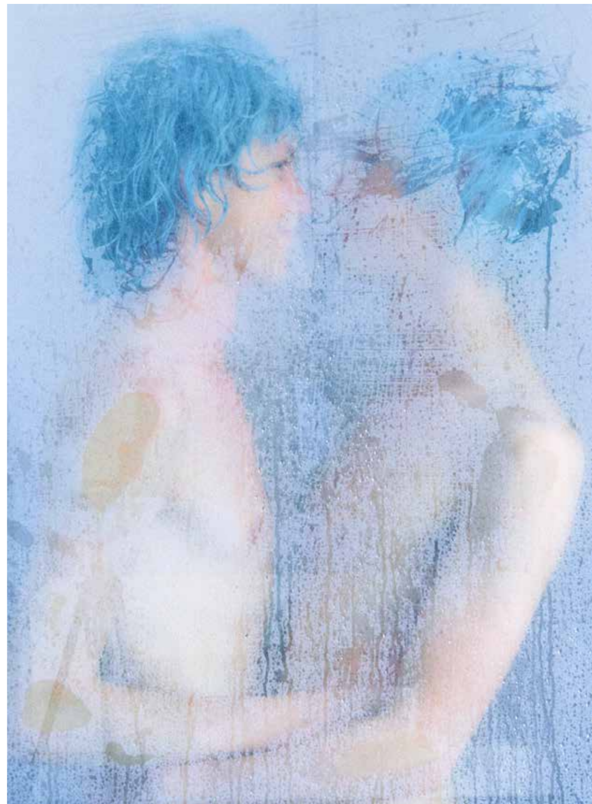
BLUE BROTHERS #1, 2024 Photographie argentique Impression pigmentaire sur papier Fine Art 110 x 150 cm Tirage 1/3 + 1 AC 30 x 40 cm Tirage 1/15 + 1 AC

Ses projets incluent les livres With Love from Russia (2021) et With Love from France (2024), dans lesquels il explore la masculinité, l'identité et les stéréotypes sociaux à travers différentes cultures, en combinant photographie et entretiens.