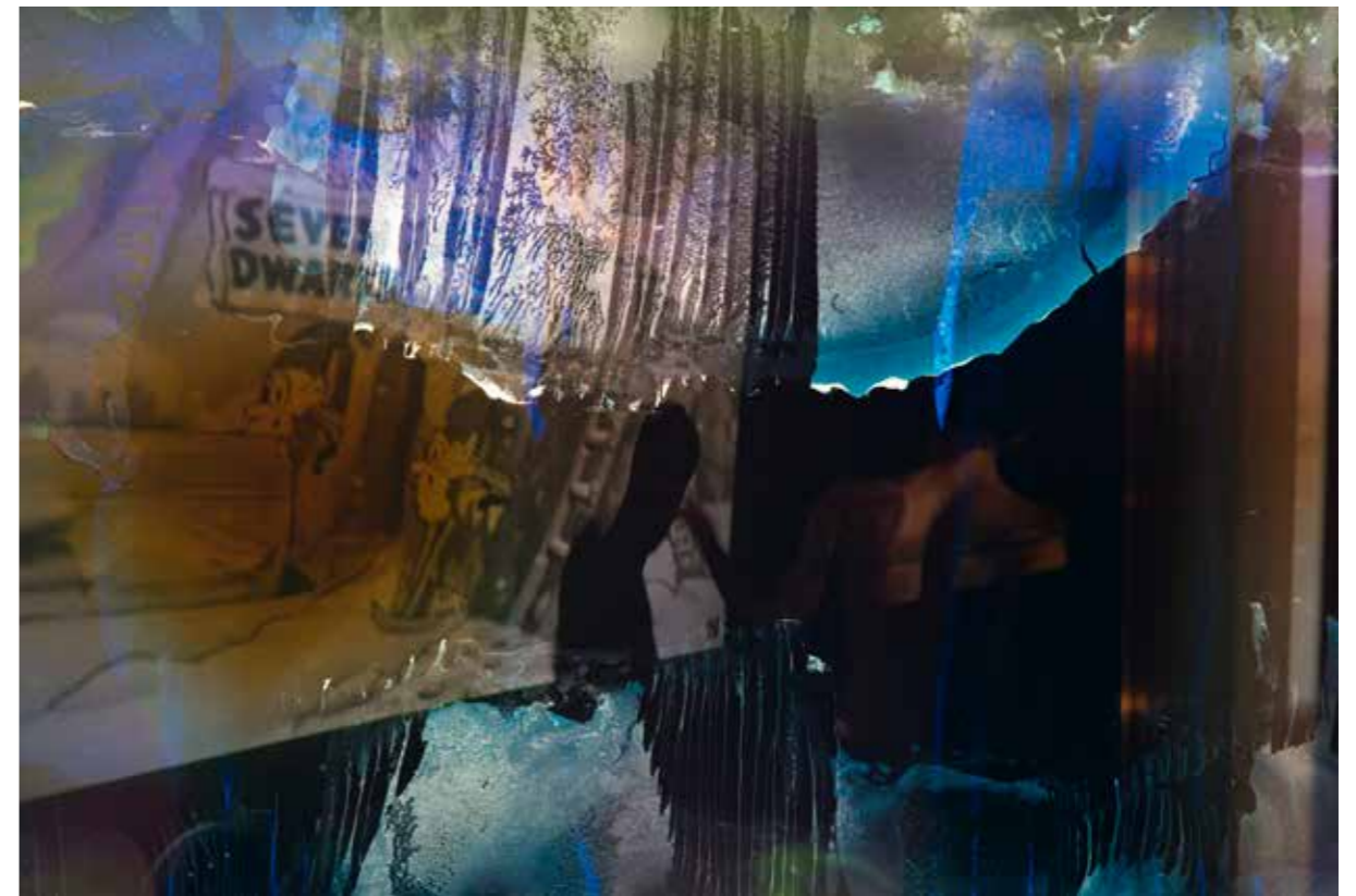
BLANCHE-NEIGE, 2026 Photographie argentique Impression pigmentaire sur papier Fine Art 40 x 60 cm Tirage 1/1

Son travail photographique prolonge cette démarche et ces thématiques, dans une pratique documentaire revendiquant un regard d'auteur. Sa série Les garçons du Levant a fait l'objet d'un livre (éd. 37.2) en 2025.