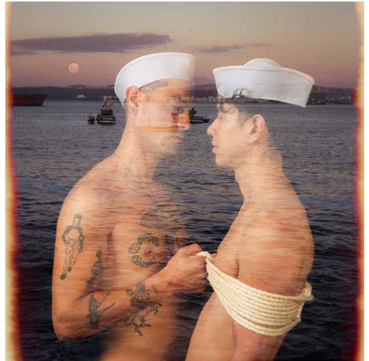
VALPARAÍSO, 2026 Photographie argentique Impression numérique sur papier Fine Art 60 x 60 cm Tirage 1/5

Lauréat de la bourse d'État pour la création artistique (Fondart). Son œuvre a été présentée dans de nombreuses expositions au Chili et au Mexique.