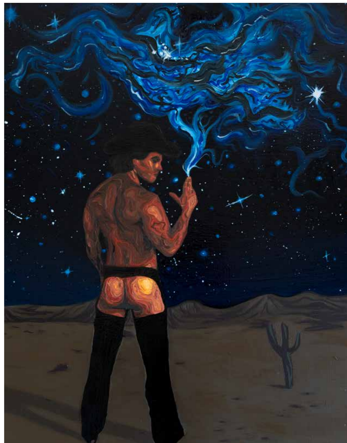
SHOOTING STARS, 2026 Huile sur bois 46 x 61 cm

Brady Austin Rider, américain, vit et travaille à Los Angeles, Californie. Il a étudié les Beaux-Arts à l'Université de Chicago et au Paris College of Art. Brady Austin Rider réalise des peintures d'inspiration psychédélique qui capturent l'énergie des gens et des lieux. Il explore continuellement la couleur, la texture et le mouvement pour mieux représenter ses sujets.