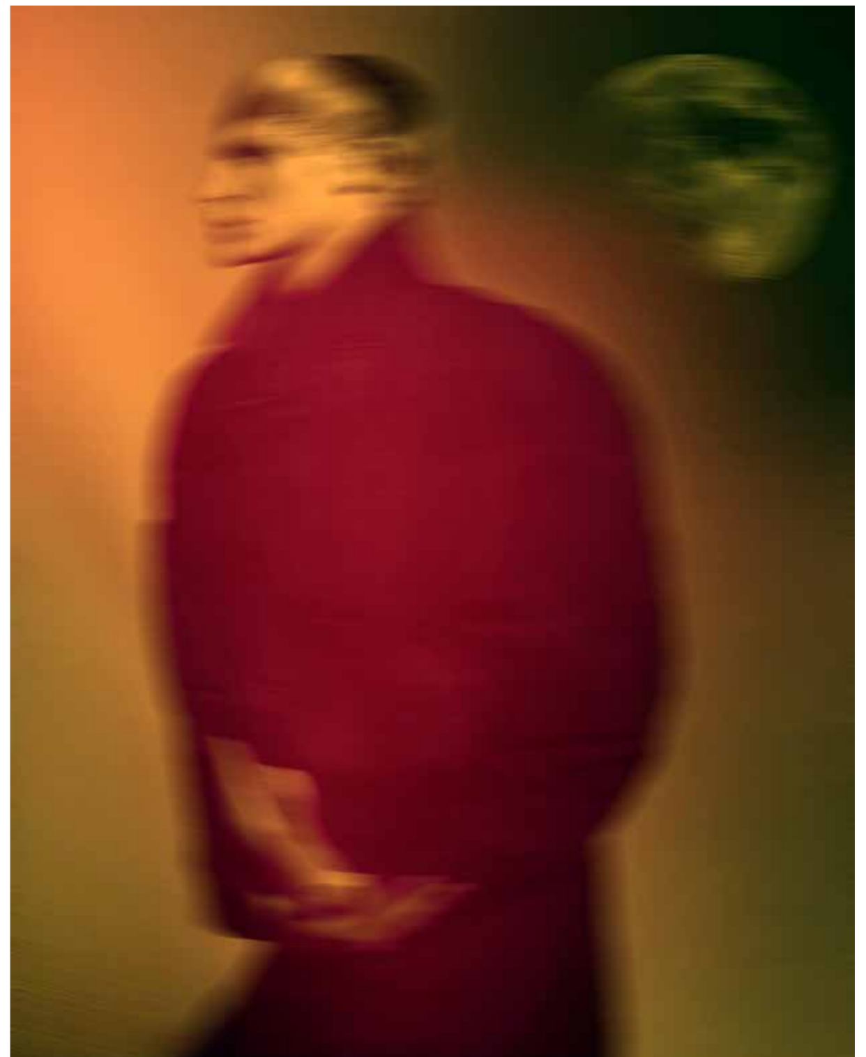
RÊVE, 2026 Photographie argentique Impression numérique sur papier Fine Art 30 x 37,5 cm Tirage 1/10 + 1 AC