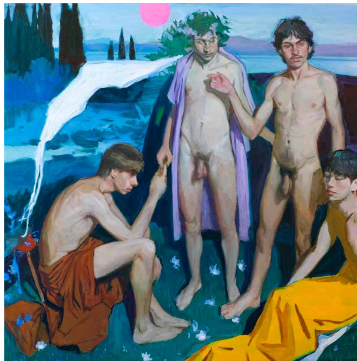
MÉMOIRE D'UN RÊVE ANCIEN, 2026 Huile sur toile 75 x 75 cm

Il a présenté des expositions personnelles dans des lieux tels que Sotheby's Stockholm, Grand Gallery Malmö, le Palais de Viana (Cordoue), l'Université de Murcie et la galerie Arniches 26 à Madrid, et a participé à des expositions collectives et foires dans des villes comme New York, Barcelone, Valence, Venise, Urbino ou Fabriano.