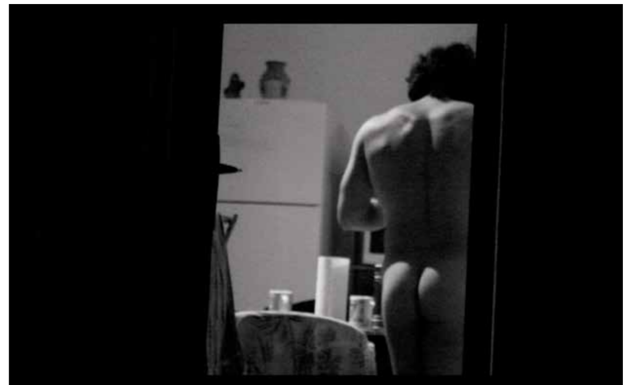
BED WITH A VIEW, 2026 Extrait de film numérique Impression numérique sur papier Fine Art 60 x 90 cm Tirage 1/3